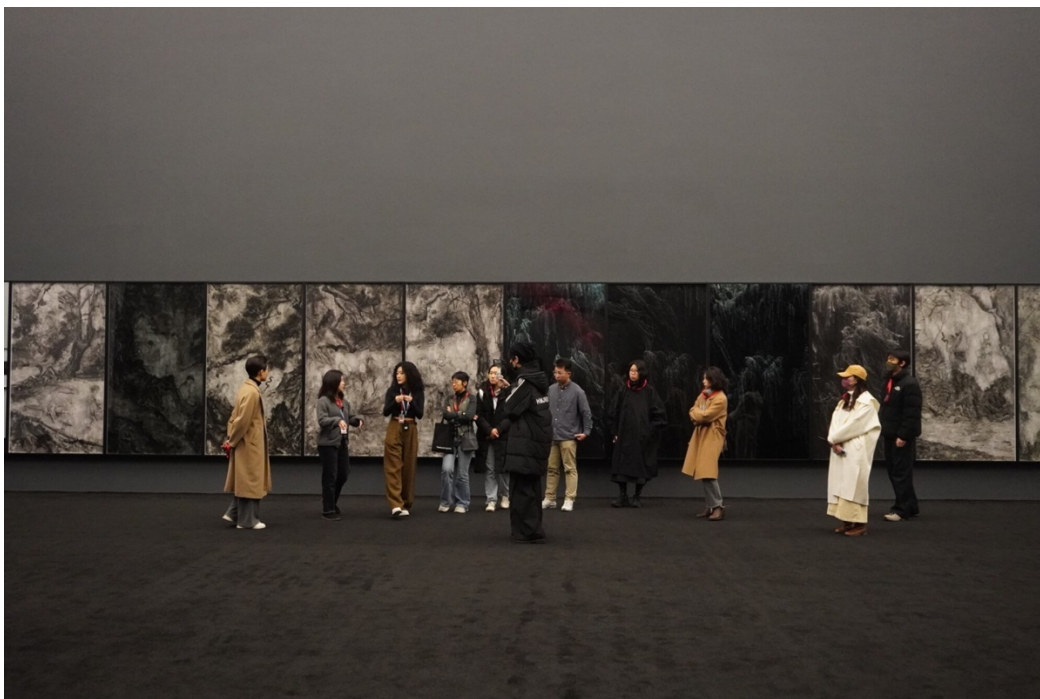
“杨福东：香河”幕后特邀导览现场，2026年1月31日，UCCA北京大展厅。

《乐郊私语》是艺术家全新创作的十五屏作品，由3个影像、4个摄影和8幅绘画组成，其原型是宋代马远的《西园雅集》。作品如同卷轴横向铺展，黑白影调中流淌着文人的诗意。面对这样一件气质内敛的作品，空间设计不在于加法，而在于减法——空间退为素净的背景，作品便在空旷中自由呼吸。展厅上方那十二根弧形大梁，以其节奏与秩序，被顺势用于空间的划分。