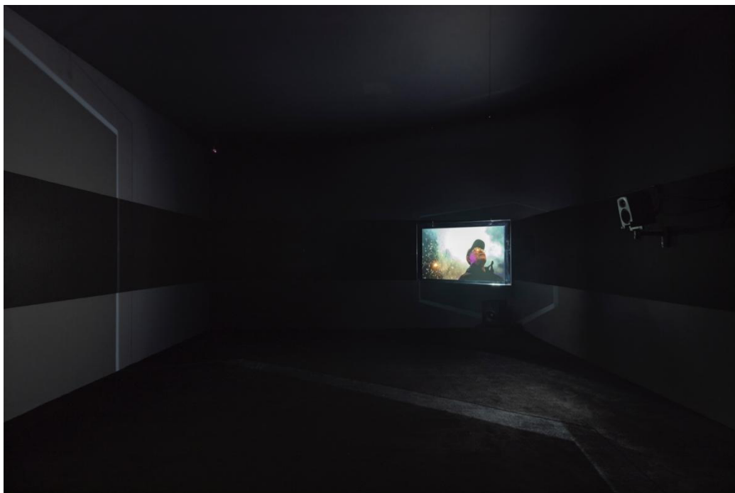
杨福东，父亲的烟火，2025。“杨福东：香河”展览现场，图片由 UCCA 尤伦斯当代艺术中心提供。

随后，观者拾级而下，行至廊桥下方，《轻风不动》（2025）静候于此。这些艺术家近十年生活相册的吉光片羽，以一种轻盈而饶有趣味的方式，悬浮于墙面之上。盒内藏有小型投影，配以图像切换时轻微的机械声响，唤起一种久违的、属于旧时光的观看仪式。这一设计源于艺术家的引导，即以怀旧的幻灯形式承载日常的私人图像，在宏大叙事的间隙，编织一场关于记忆的温柔游戏。装置细节与整体空间设计保持着高度统一：质感冷峻的金属箱体、与桥底刻意露出的工字钢结构、悬浮感的玻璃以及经过反复比对的背投膜……它们共同在厚重硬朗的建筑体量中，注入了灵动的呼吸，亦恰如记忆本身——沉重之中，总有虚浮闪烁的碎片，时而明亮、时而黯淡、上下翻飞、起伏不定。