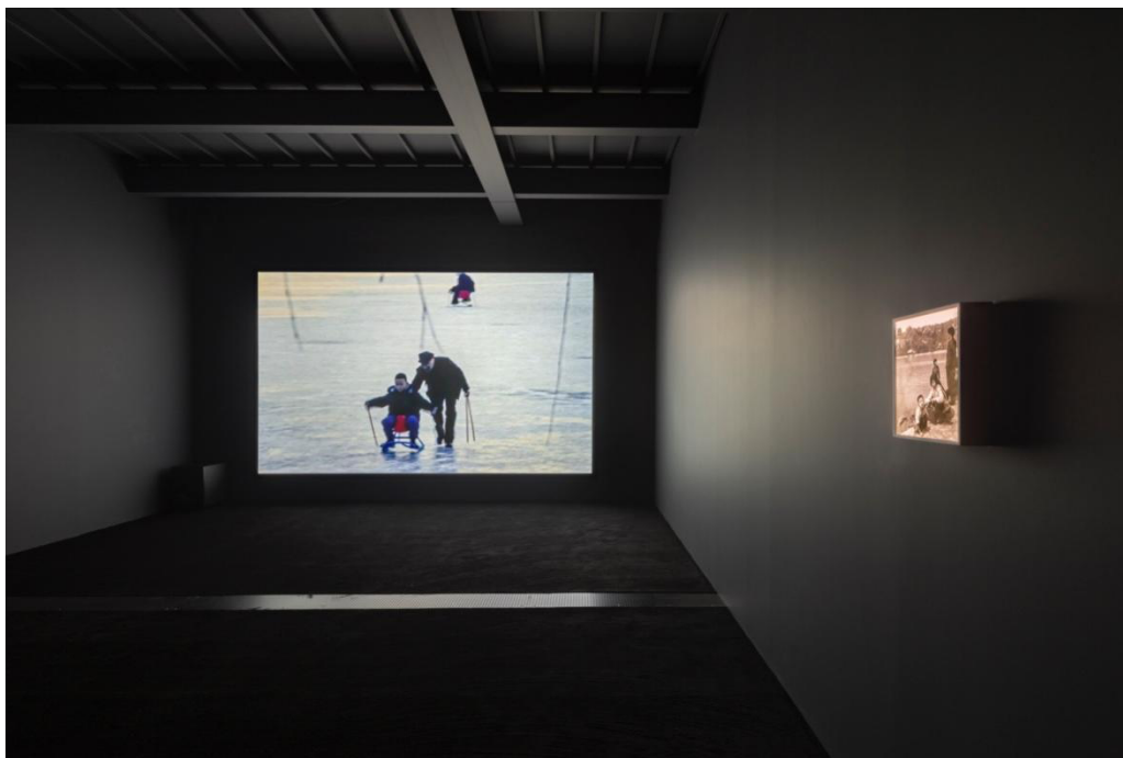
杨福东，在颐和园，2024-2025。“杨福东：香河”展览现场

淀着岁月的温度。此外，地台的尺寸亦经反复推敲，既要保证观者舒适的游走与观看，亦需维持与其上家具、电视机等装置之间的呼吸感。