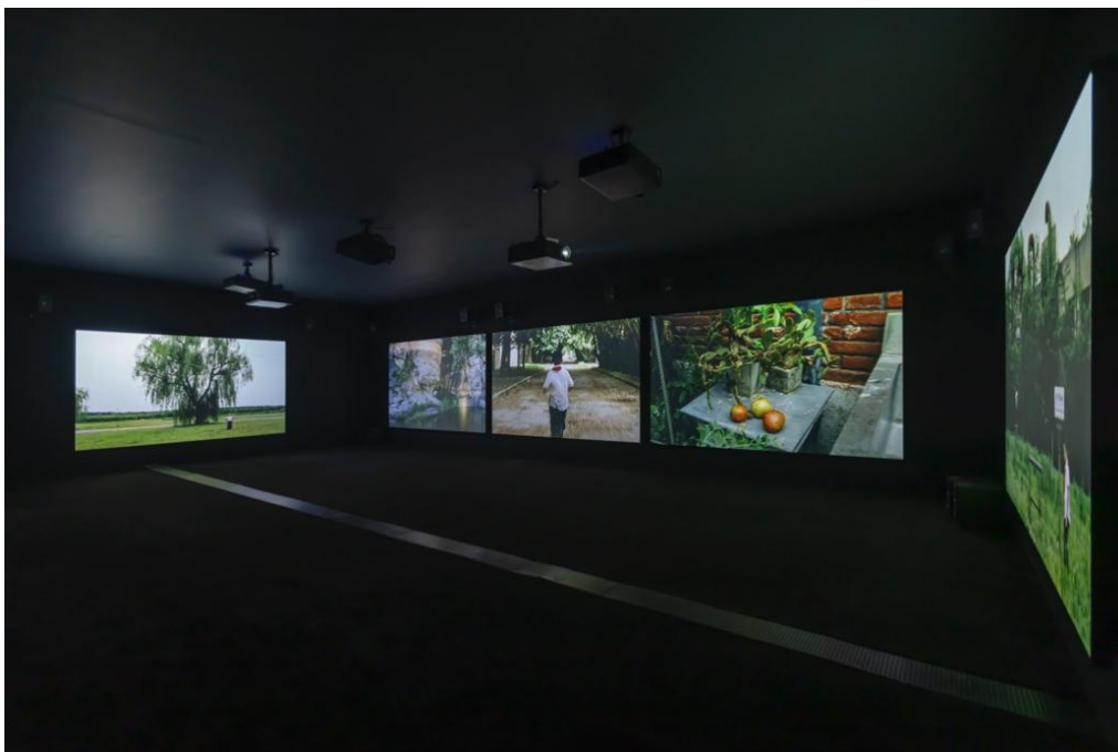
杨福东，少年少年，2025。“杨福东：香河”展览现场，图片由 UCCA 尤伦斯当代艺术中心提供。

《少年少年》（2025）展厅外。入口处的门被设计为高 3.5 米、宽 1.5 米的细长门洞，宛如一面影壁，以庄重而内敛的形态，在观众踏入影像世界前营造出强烈的仪式感。双层帘幕的介入，不仅在物理层面隔绝了外界的光线，确保观者在面对首件作品时的全然沉浸，更在心理维度上完成了一次巧妙的过渡：从明亮的现实，潜入幽深的记忆之河。