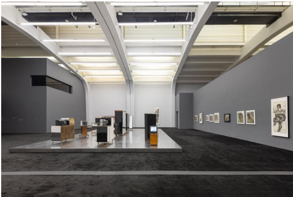
“杨福东：香河”展览现场，图片由 UCCA 尤伦斯当代艺术中心提供。

《香河》由十五个非线性影像构成，空间的出入口分置两侧，不设先后。艺术家关于“乡愁”的极致意象叙述，正是在这一黑匣子中徐徐展开。在一个超现实与具象片段交织的环境中，画面与声音的包裹感成为空间设计的核心命题：如何为作品提供一个恰如其分的空间氛围，却不分散观者行走与观看时的注意力？如何保证作品中声音的品质，避免来回反射与混杂？为此，团队选择了毛毡作为墙面材料——它在声场控制与视觉上的“无侵略性”方面，都恰到好处。此外，墙面并非单一的黑，而是通过两种不同质感的毛毡——纯平与规律开槽——的交替运用，在统一的暗色调中制造出微妙的肌理差异。甚至那些展厅细节——保证空气流通的通风扇、座椅的样式与摆放位置——无一不是反复推敲后的结果。因此，它们共同支撑起一个充满呼吸感的场域，让观者得以全然沉入，在艺术家那黑白、诗意、流转于超现实与真实之间的影像世界中，完成一场关于时间与记忆的私密旅程。